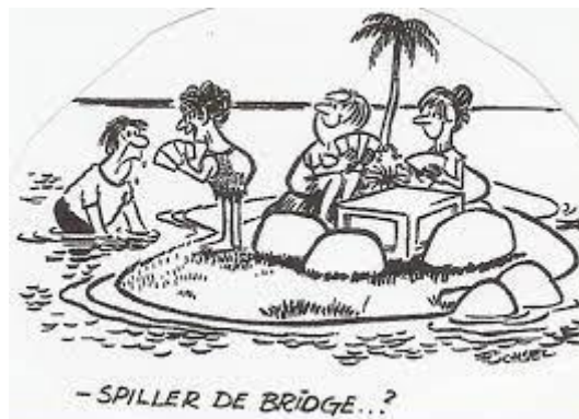
- SPILLER DE BRIDGE... ?