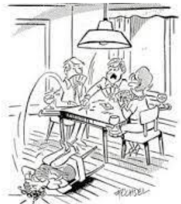
Hvad skulle jeg så ha' spillet ud... ?

Der er fri adgang, og tilmelding er ikke nødvendig, men mød venligst op 10 minutter før spilstart. Indskud: 40 kr. pr. person. Juniorer under uddannelse dog kun 10 kr. 4-klips kort koster 120 kr og sommersæsonkort koster 250 kr.